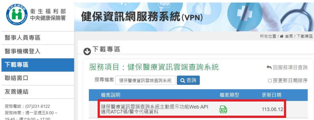
圖 1 VPN 下載專區畫面

二、請至 VPN 首頁(https://medvpn.nhi.gov.tw)之下載專區，選擇服務項目為「健保醫療資訊雲端查詢系統」，點選 CSV 下載，如圖 1。